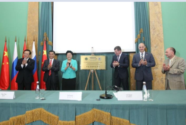
刘延东副总理出席“中俄高铁研究中心揭牌仪式” Вице-премьера Госсовета Лю Яньдун приняла участие на церемонии открытия «Российско-китайского исследовательского центра ВСМ»

3-го июля 2016г., вице-премьера Госсовета Лю Яньдун приняла участие на церемонии открытия «Российско-китайского исследовательского центра высокоскоростного железнодорожного сообщения», созданный Пекинским транспортным университетом, ПГУПСом и МГУПСом.