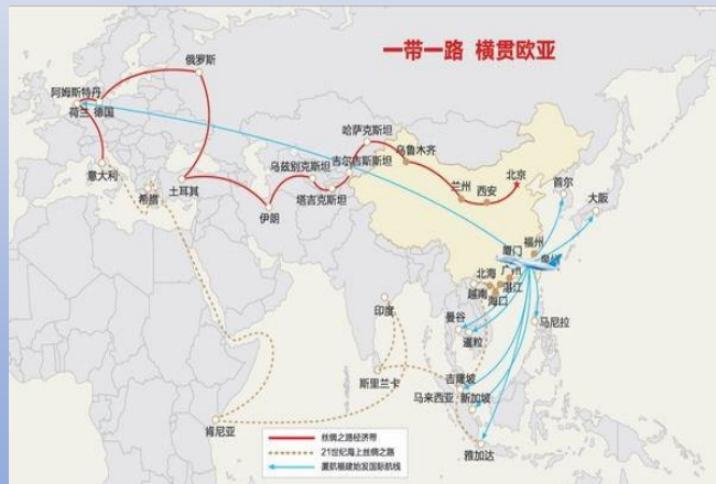
两国重大战略对接