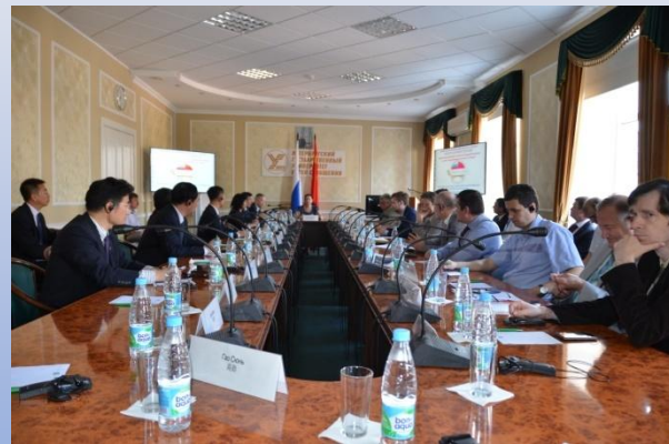
中俄高铁发展圆桌会议 Круглый стол по развитию ВСМ между Россией и Китаем