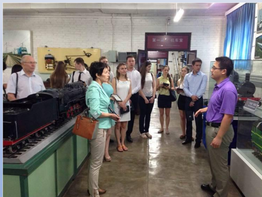
西伯利亚国立交通大学高速铁路培训 2015 Семинар по ВСМ для студентов из СГУПС в 2015г.