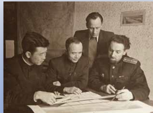
俄罗斯铁路专家指导工作

Фото китайских и русских учёных в Пекинском транспортном университете