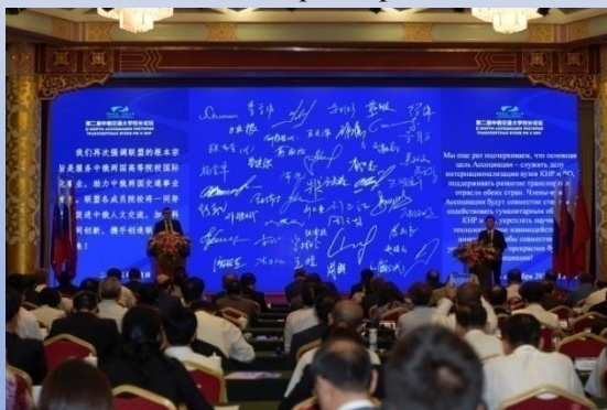
第二届中俄交通大学校长论坛

Первый форум ректоров транспортных вузов России и Китая