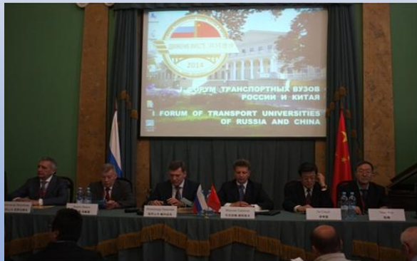
首届中俄交通大学校长论坛

Премьер Госсовета КНР Ли Кэцян направил поздравительное письмо.