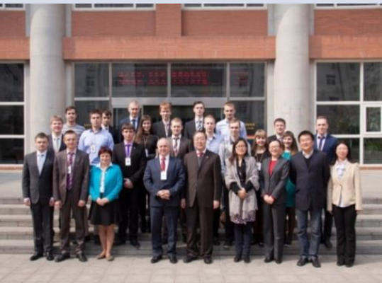
圣彼得堡国立交通大学高速铁路培训 2015 Семинар по ВСМ для студентов из СПбУПС в 2015г.

Проводятся семинары по транспорту, укреплять экспорта образовательных ресурсов