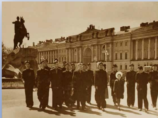
中国铁路专家访问圣彼得堡

52 китайских студента поехали в МИИТ и СПУПС на обучение.