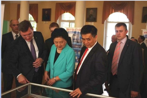
刘延东副总理参观中俄交通类院校合作优秀成果展 Вице-премьера Госсовета Лю Яньдун посетила выставку по достижениям в области сотрудничества между вузами России и Китая