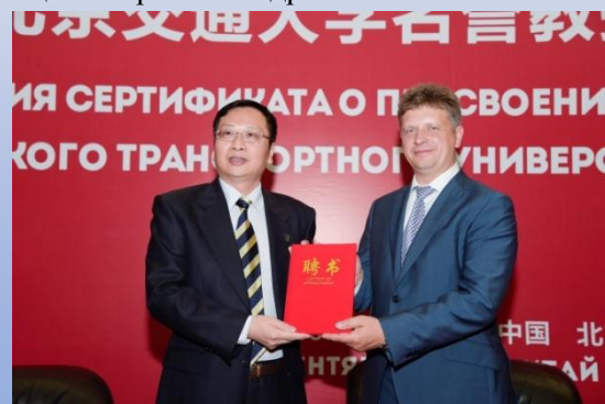
俄罗斯联邦运输部部长受聘我校名誉教授

Второй форум ректоров транспортных вузов России и Китая