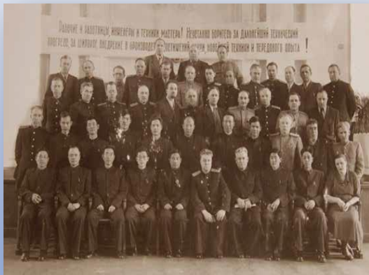
中俄铁路专家在我校合影

Китайский учёные по железной дороге посетили Санкт-Петербург