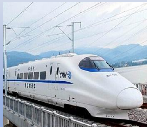
中国高铁走向世界