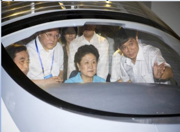
刘延东副总理来我校视察

Пекинский транспортный университет в этом году отмечается 120-летия юбилея. является лидером среди китайских транспортных университетов, колыбелью китайского образования в области железнодорожного управления, телекоммуникацией в новейшей истории.